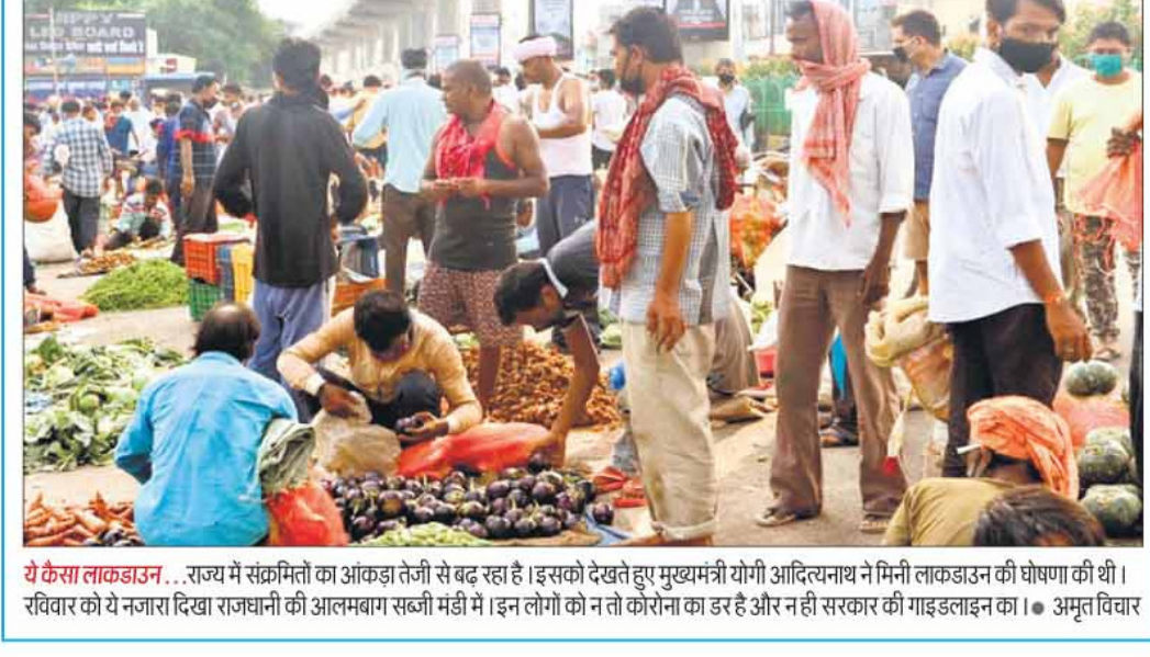
ये कैसा लाकडाउन... राज्य में संक्रमितों का आंकड़ा तेजी से बढ़ रहा है। इसको देखते हुए मुख्यमंत्री योगी आदित्यनाथ ने मिनी लाकडाउन की घोषणा की थी। रविवार को ये नजारा दिखा राजधानी की आलमबाग सब्जी मंडी में। इन लोगों को न तो कोरोना का डर है और न ही सरकार की गाइडलाइन का।